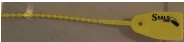
Fig. 1 - Plastic zegel