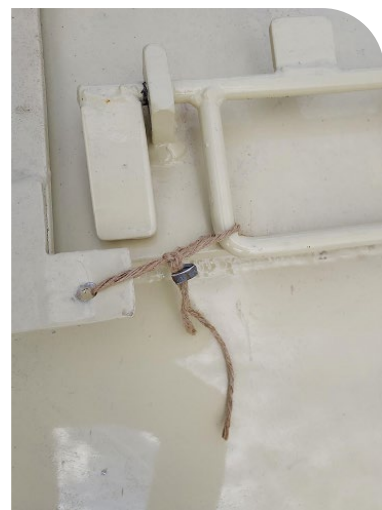
Fig. 2 - Touw met genummerd loodje