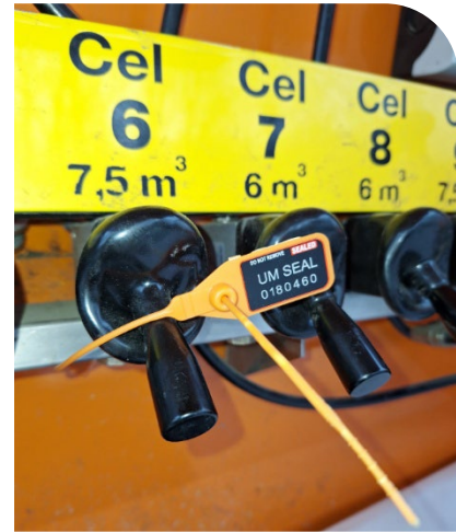
Fig. 5 - Verzegeling achteraan vrachtwagen bij ventielen

Conclusie: er wordt bij elke levering bovenaan een verzegeling gedaan. Indien het fysiek onmogelijk is om achteraan een verzegeling uit te voeren, is verzegeling hier niet noodzakelijk.