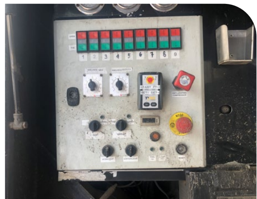
Fig. 3 - Bedieningspaneel met druk -en draaiknoppen

Er wordt echter een derogatie toegekend door het FAVV voor verzegeling achteraan als verzegeling fysiek onmogelijk is (bv. ter hoogte van het bedieningspaneel in geval van draai -en/of drukknoppen - fig. 3).